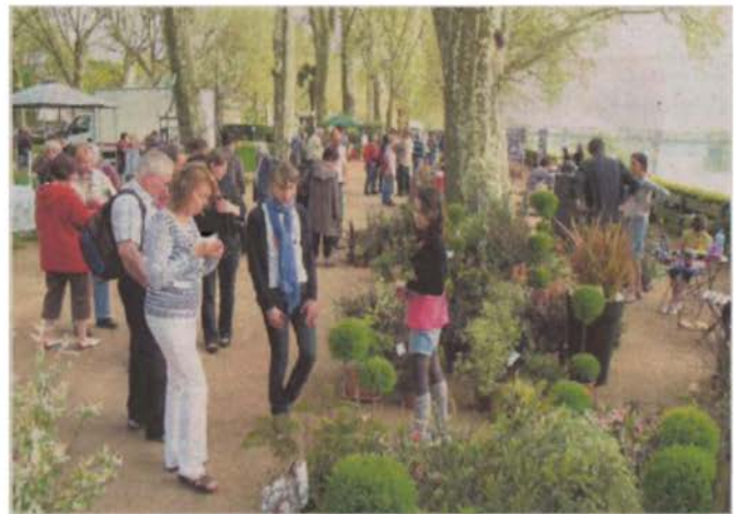
Le cadre est idéal pour une telle manifestation.