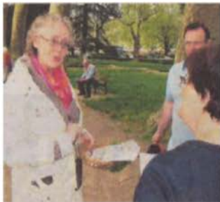
Les membres du Rotary ont vendu des programmes donnant accès à la tombola.

Organisée en quelques semaines, cette première édition du « Printemps des jardins » a réuni une vingtaine d'exposants professionnels, venus de tout le